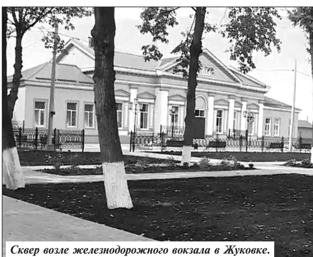
Сквер возле железнодорожного вокзала в Жуковке.