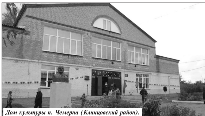
Дом культуры п. Черерна (Клинцовский район).