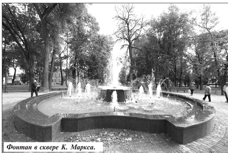
Фонтан в сквере К. Маркса.