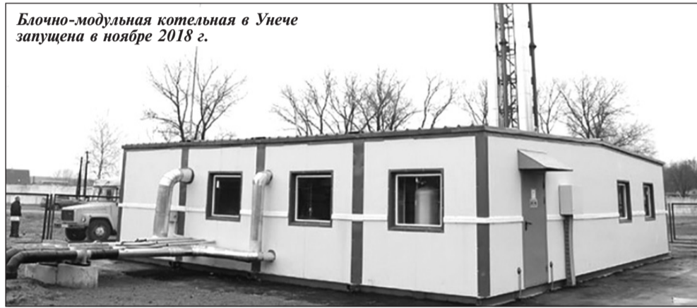
Блочно-модульная котельная в Унече запущена в ноябре 2018 г.