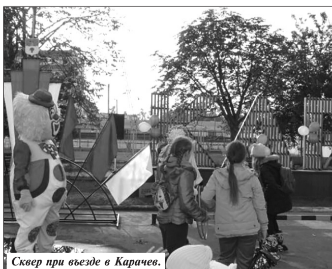
Сквер при въезде в Карачев.