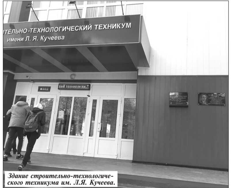
Здание строительно-технологического техникума им. Л.Я. Кучеева.