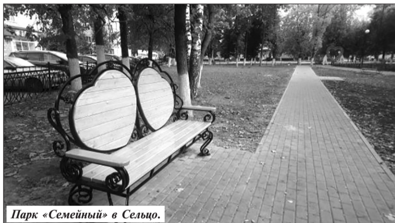
Парк «Семейный» в Сельцо.