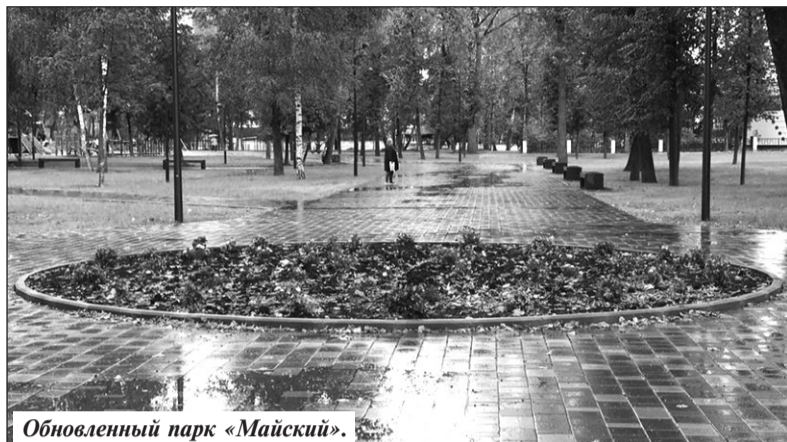
Обновленный парк «Майский».